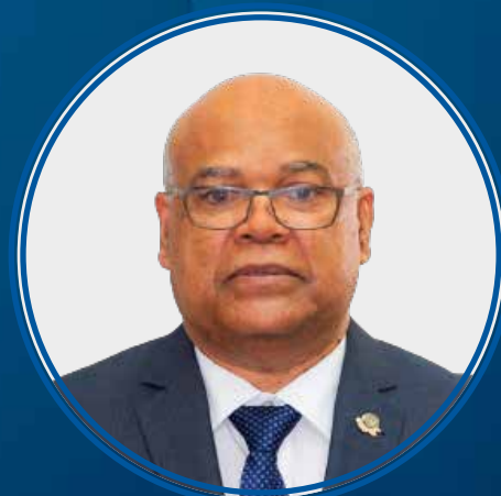
Obispo Hipólito Suero 1er. Vocal